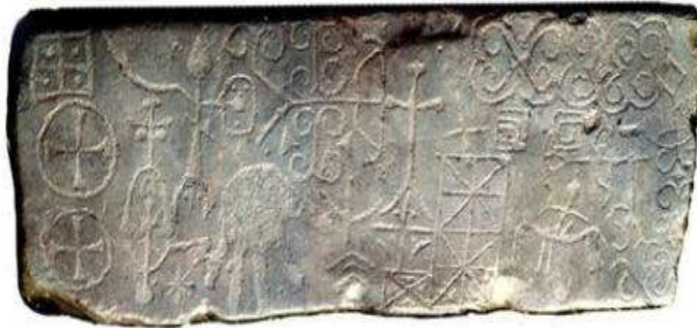
ხევსურეთი, სოფელი ზემო კისგანი. ნასახლარში შემორჩენილი ქვა. (ამჟამად ინახება დაბა ქიხვალში ვიორგი ჭინჭარაულის სახლში) ზომა 100X40 სმ.