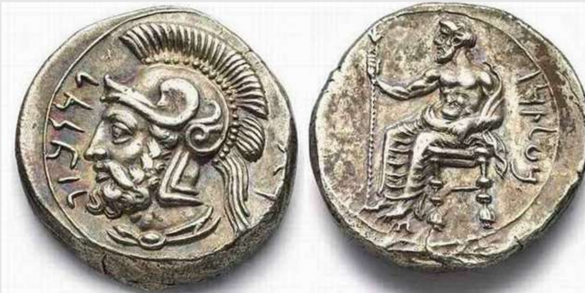
Ancient coins - Greece

Cilicia, Tarsus, Satrap Pharnabazus, 379 - 374 BC, stater, cf. BMC 165, 21, 10,97g - fine toning and of good style