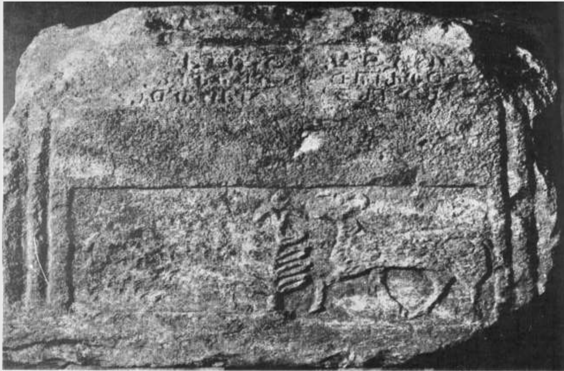
სტელის ბაზი სამსტრიგონიანი ისომთაერლი წარწერით ვერძების გამოსახულებით, სიკოცხლის ხესთან